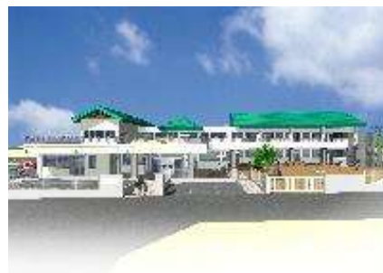
開園が待たれる請西保育園完成予想図