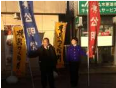
新年の挨拶を1月4日木更津駅から

公明党は、昨年9月、「大衆とともに」の立党精神の継承から50周年を機に新たな前進を開始して、昨年末の衆議院選挙では、