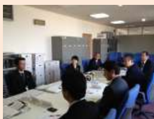
空き家バンク制度について説明を受ける

新庁舎建設（両市共）と豊後大野市の定住人口促進事業空き家バンク制度について視察・研修をしてまいりました。