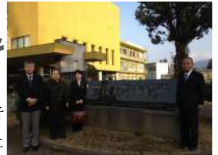
1月16日大分県豊後大野市視察

の皆様の献身的なご支援により大勝利を果たすことができました。さて本年は、1月から、