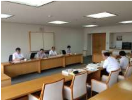
岡谷市にて子育て課の説明を受ける

活かした地域の活性化を実現しております。 デマンドバス「あづみん」と受付センターを視察 また、少子高齢化が進む本市にとって、子育て施策は重要施策のひとつであります。岡谷市では、行政組織に「健康福祉部・子育て課」が設けられ、教育委員会と連携をとりながら「病児・病後児保育」など、多くの事業を展開しております。本市にとって非常に学ぶべきものが多く、今後の施策展開に生かしてまいりたいと考えております。