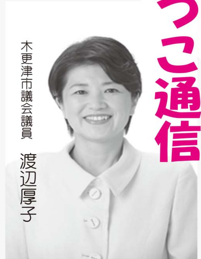
木更津市議会議員