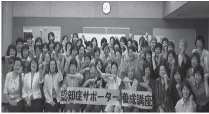
女性党员さん約60名が「認知症サポーター養成講座」を受講後、オレンジリングを腕に記念撮影（9/11 富来田公民館にて）