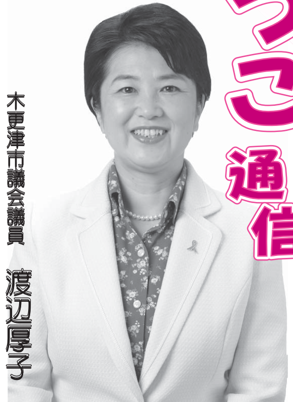
木更津市議会議員