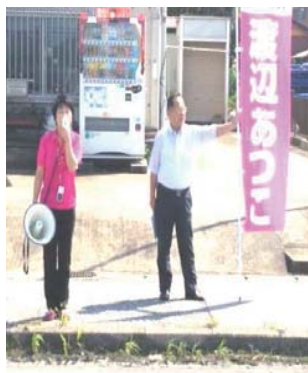
議会報告街頭演説 9月22日せんだう前