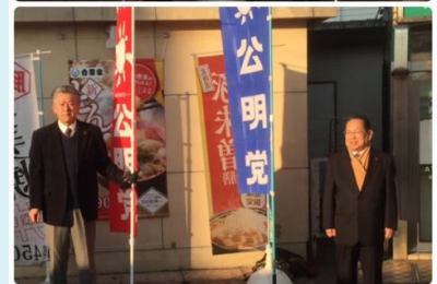
(写真)・1月4日に新年の挨拶を木更津駅東口にて行いました。